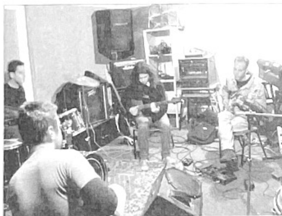
Improvisation au sein du programme musical

"Les amis de Beit Ham" 5 King George St P.O.B. 37065 Jérusalem