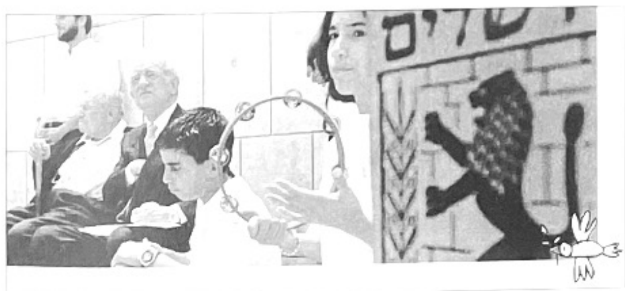
Visite du Président de la République Fédérale D'Allemagne.

Comme au "Jardin de la Paix", l'enseignement y est dispensé dans les deux langues et chaque classe est co-dirigée par deux enseignants. Un effort particulier devrait être fait dans les années à venir pour que les cultures et droits légitimes des juifs et arabes soient intégrés dans le programme éducatif et que l'histoire de la région soit présentée le plus justement possible.