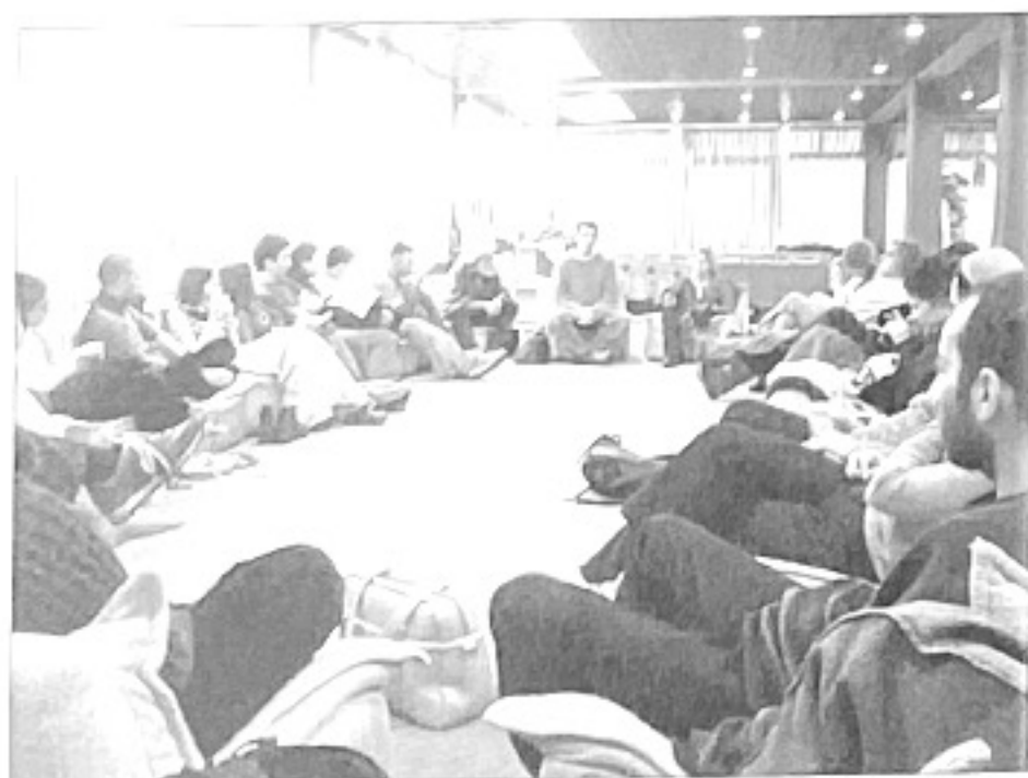
Réunion des cadres de Beit-Ham

Déjà retenue l'an dernier pour le Prix de la Fondation, Beit Ham poursuit son action sur le terrain, en ouvrant de nouveaux centres dans les quartiers en détresse et développe ses programmes socio-éducatifs en faveur de la rencontre entre les peuples israélien et palestinien.